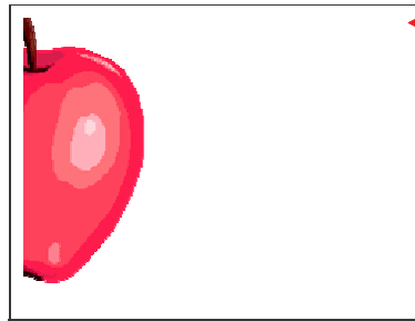
Tableau mis en forme